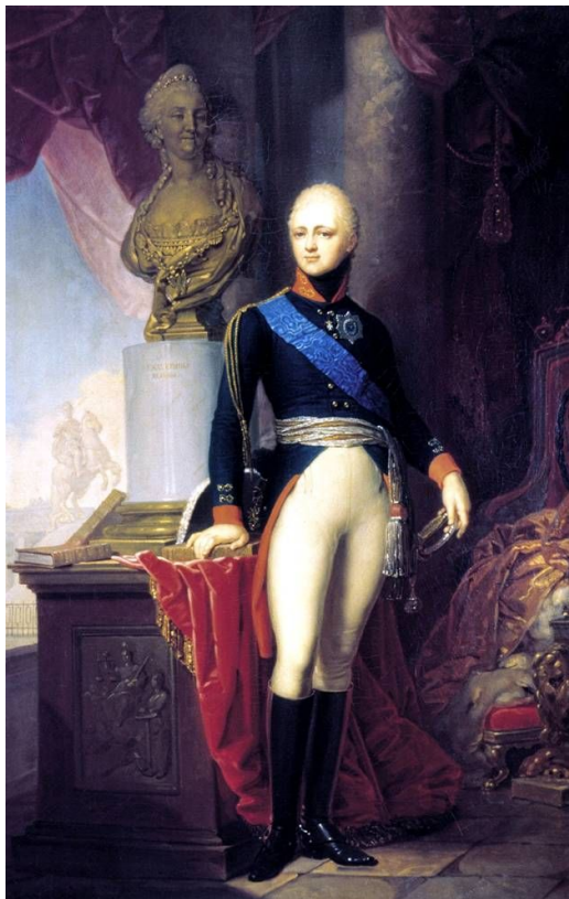
Александр I (1801-1825)